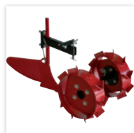
Kit complet (Roues fer, butteur, arrache pommes de terre, charrue, perche et moyeux) Ref 8000020105